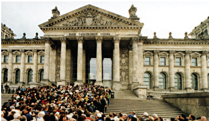
Sediul Parlamentului Germaniei, simbol al reunificării.

Configurația Europei la început de mileniu, calitatea ei de model deschis, gata să se supună necesității de a permite atașarea tuturor țărilor europene, acumulează elemente cu deschidere spre viitor. Acest proiect fără precedent în istoria Europei depinde, în ultimă instanță, de capacitatea oamenilor de a urmări împreună un ideal comun. Realizarea acestui proiect va permite afirmarea Europei între statele care modelează lumea viitorului; șansa împlinirii acestui rol istoric este mai bună decât a fiecărui stat component în parte, incluzând aici chiar Germania, cu potențialul ei acum impresionant. Realizarea Uniunii Europene va putea arăta rolul Europei în lume după retragerea europenilor din imperiile coloniale.