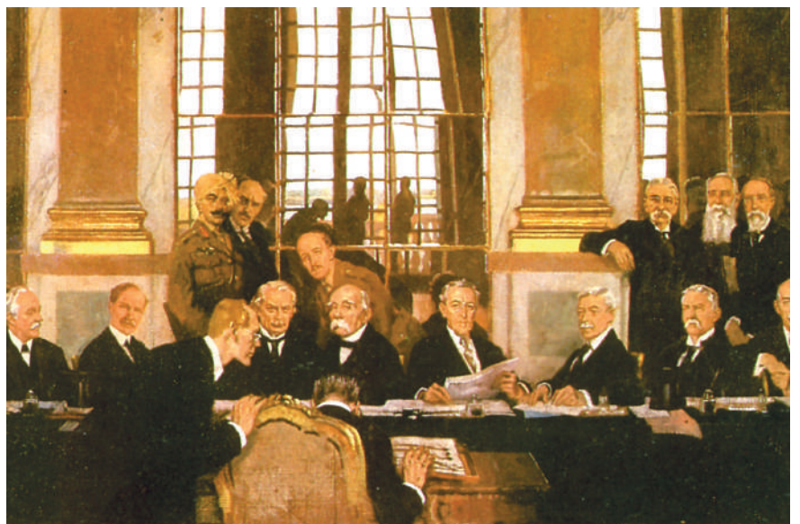
Semnarea armistițiului cu Germania (11 noiembrie 1918) a însemnat nu doar sfârșitul războiului, ci și punctul de plecare al unor noi probleme pentru puterile europene.

Reconversia economiei statelor foste beligerante la necesitățile perioadei de pace a pus variate probleme și abia în 1924–1925 se apreciază revenirea la