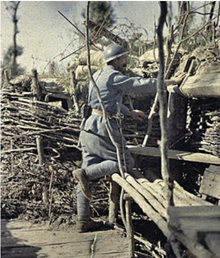
În tranșeele Marelui Război

Programul președintelui Wilson, Cele 14 puncte , are în vedere erodarea supremației Europei: