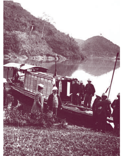
Militari și civili francezi pe malul fluviului Mekong (Indochina)

„În toate țările colonizatoare, oamenii politici și grupurile de presiune imperialiste au găsit sprijin pe lângă puternicele curente de opinie care își au obârșia în marele val naționalist de la sfârșitul secolului al XIX-lea. Într-adevăr, pentru mulți europeni, cucerirea colonială este un mod de afirmare a puterii și geniului poporului căruia le aparțin și de a da frâu liber dorinței de putere. (...) Considerând civilizația lor superioară tuturor celorlalte, europeanii cred că au o «misiune» de îndeplinit pe lângă popoarele colonizate și aceasta este de a le aduce progresul.”