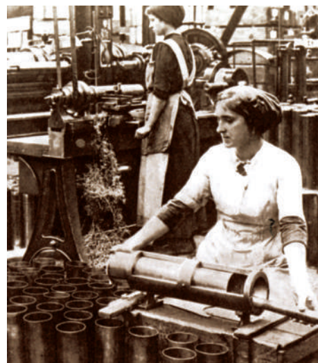
În timpul războiului, tot mai multe femei au părăsit cadrul familial pentru a ocupa o slujbă.

Decolonizarea a fost una dintre consecințele celui de-Al Doilea Război Mondial și a contribuit la schimbarea hărții politice a lumii.