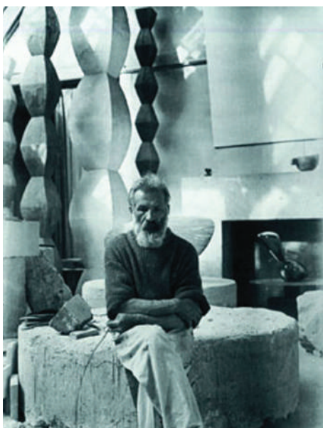
Constantin Brâncuși în atelierul său de la Paris

„Din toată ființa lui se degaja un spirit precis, de om care își trăiește ființa, privește lucrurile și oamenii, parcă tot ce vede se mișcă într-o geometrie plastică de forme sintetic primare. (...) la vârsta la care părul începuse să albească, obrazul lui avea o frăgezime, o culoare luminoasă care dădea un deosebit farmec și pune în valoare zâmbetul, vioiciunea și strălucirea ochilor lui (...).”