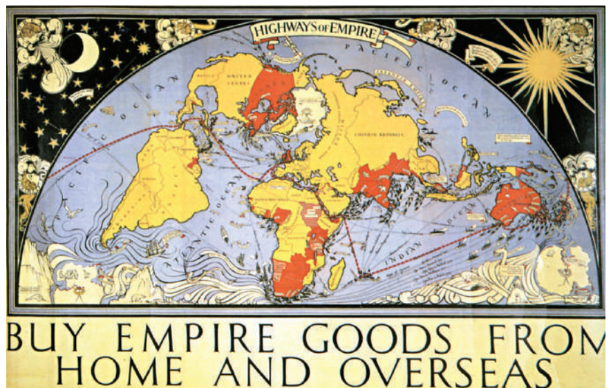
Afiș care preamărește imperiul colonial britanic

În esență, superioritatea productivității muncii și a nivelului de trai constituie baza superiorității civilizației europene, impulsul pentru dominarea altor spații, pentru asigurarea hegemoniei Europei în lume. Această hegemonie are