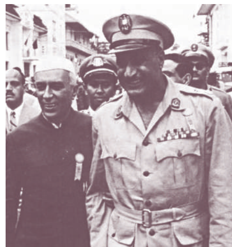
Jawaharlal Nehru și Gamal Abdel Nasser, inițiatorii mișcării de nealinieră.

Cel mai important moment în apariția noilor state a fost adoptarea de către ONU a Rezoluției 1514 , prin care se recunoștea popoarelor din colonii dreptul de a-și hotărî singure soarta. Anul adoptării acestui important document (1960) a fost numit Anul Africii, deoarece 18 state de pe acest continent și-au proclamat independența. Conferința de la Addis-Abeba, din mai 1963, a putut astfel hotărî înființarea Organizației Unității Africane (OUA) și adoptarea unei Carte a unității africane , semnată de 30 de state, care și-au afirmat poziția de neutralitate. Până în 1970, au apărut 64 de state independente, iar marile imperii coloniale au dispărut. Au fost introduse concepte noi, cum ar fi cel de africanism , o mișcare capabilă să canalizeze eforturile comune pentru lichidarea subdezvoltării și a altor urmări ale colonialismului, sau cel de negritudine pentru a desemna tradiția și cultura comună a Africii negre. OUA a elaborat o Cartă africană a drepturilor omului și ale popoarelor , adoptată la 28 iunie 1981, instituind o comisie în domeniu, compusă din 11 membri aleși de Conferința șefilor de state, iar în anul 1991 a stabilit principiul necesității unei piețe africane comune, realizabilă, conform documentului, abia în 2025.