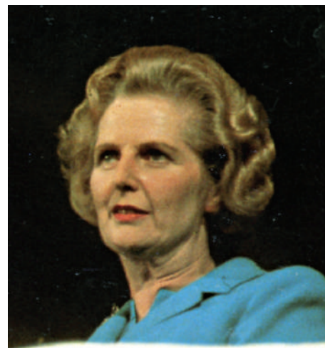
Margaret Thatcher, prima femeie premier într-un stat european (Marea Britanie)