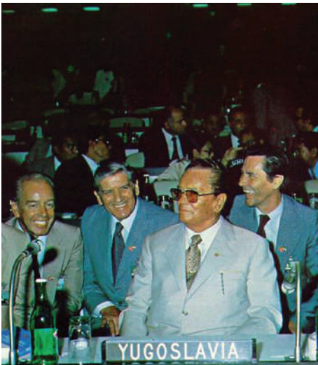
Iosip Broz Tito la Conferința statelor nealiniate de la Havana (1979)

Iosip Broz Tito, președintele Iugoslaviei, despre politica de nealinieră: