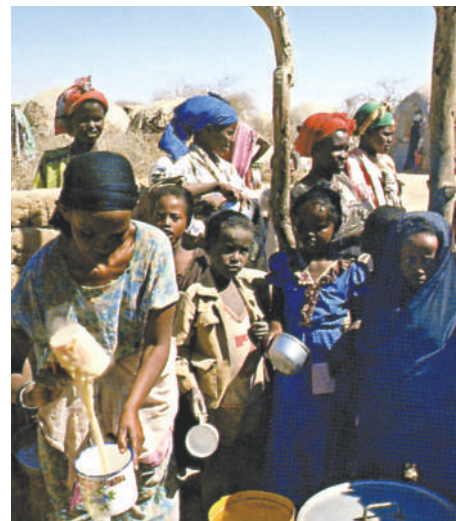
Imagine din Lumea a treia, unde se estimează că aproape 70% dintre copii suferă de malnutriție.

Aceste țări nu-și permit măsuri care să combată poluarea, înregistrându-se o degradare succesivă a mediului. Unele industrii accentuat poluante sunt împinse către Lumea a treia, unde și forța de muncă este mult mai ieftină. La sfârșitul mileniului al II-lea, mondializarea economiei a deplasat industria prelucrătoare și capitalurile aferente investițiilor în acest domeniu către statele asiatice, unde forța de muncă este mult mai ieftină. Există, desigur, și excepții, cum este cazul Nigeriei, care dispune de însemnate rezerve de petrol, dar care prezintă o anume fragilitate a economiei, chiar dacă există capitaluri de investit.