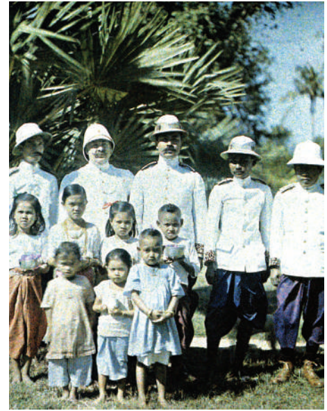
Funcționar francez din Indochina înconjurat de slujbași și de copii cambodgieni (1921)

Revenind la imperiile coloniale ca surse de putere pentru metropole, să menționăm faptul că exemplul cel mai bun în privința eficienței economice este al coloniei Congo, stat suveran sub Leopold al II-lea al Belgiei și colonie belgiană între 1908 și 1940. Dorința metropolelor de a face rentabilă exploatarea coloniilor este evidentă, dar forma instituțională a acestei dorințe (ministere ale coloniilor, legislație adecvată și investiții aferente) întârzie să apară. La 1900, o lege franceză stipula că fiecare colonie trebuie să trăiască din propriile venituri. Eficiența economică a federațiilor Africa Occidentală (creată în 1904) și Africa Ecuatorială (creată în 1910) depindea de legarea lor, cu ajutorul căii ferate, de teritoriile franceze din Africa de Nord. Lipsa fondurilor a năruit proiectul