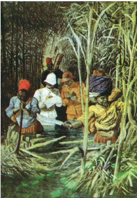
Francezi și germani trasează frontierele în Congo