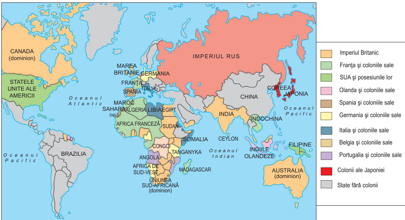
Principalele imperii coloniale (sfârșitul sec. XIX – începutul sec. XX)