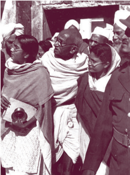
Mahatma Gandhi într-un grup de adepți

„India este atât de săracă, încât nu poate rezista foametei. Înainte de venirea englezilor, India țesea și torcea suficient în milioanele sale de colibe pentru a adăuga agriculturii resursele care îi erau necesare. Această industrie sătească atât de vitală pentru existența Indiei a fost ruinată prin procedee inumane și crude, trasate de englezi ca fiind dovezi (în favoarea lor).”