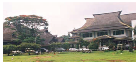
Bandung, campusul universitar

„Ceea ce i-a distrus totalmente pe vechii colonialiști a fost dovada că oamenii albi și statele lor ar putea fi înfrânți rușinos și dezonorant, iar vechile puteri coloniale erau în mod evident prea slabe pentru a-și restaura vechile lor poziții, chiar și după un război victorios.”