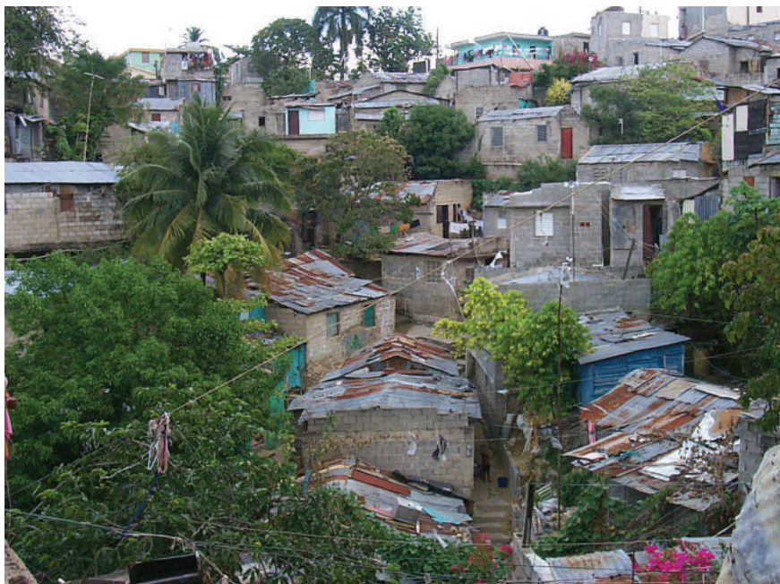
Bidonvil în Lumea a treia

Rezoluția 1514, adoptată de Adunarea Generală a ONU la 14 decembrie 1960