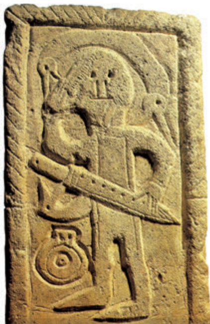
Alamanii și bavarii

De-abia în jurul anului 480 francii vor ajunge în prim plan: căpetenia unuia dintre aceste grupuri, Clodoveu, a reușit să îi unească sub conducerea sa pe salieni și a început o îndelungată politică de expansiune în urma căreia a reușit să controleze aproape întreaga Galie. Galo-romanii din zona Parisului au fost primii care au căzut sub puterea francă după învingerea căpeteniei lor, Siagrius, în bătălia de la Soissons. Mai târziu, alamanii și turingienii, învinși la Tolbiac, și-au văzut întreruptă expansiunea către sud și au fost nevoiți să recunoască suveranitatea francă. Ultimii învinși vor fi vizigoții, care vor pierde controlul asupra centrului și sudului Galiei și care vor părăsi țara după înfrângerea lui Alaric al II-lea în bătălia de la Vouillé. Doar burgunzii s-au menținut departe de conflict, grație unui pact semnat între regele Gundabald și Clodoveu, garantat de căsătoria monarhului franc cu o prințesă burgundă, Clotilda. Sub influența acesteia va accepta Clodoveu creștinarea și, odată cu el, o bună parte din popor va trece la noua confesiune. Această strategie i-a atras simpatia și acordul galo-romanilor și va fi hotărâtoare în lupta împotriva vizigoților arieni.