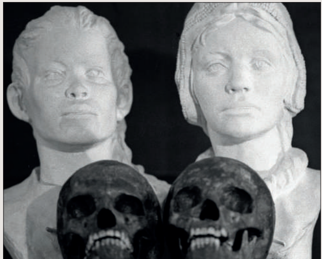
Dreapta: Reconstituire antropologică a înfățișării copiilor din Sunghir

persoana sacrificată, cu atât mai semnificativ era sacrificiul. Acest lucru pare dovedit de tratarea osemintelor lor cu ocră roșu, făcut din argilă, și cu coaserea a circa 5 000 de mărgelă de fildeș pe hainele și cușmele lor din piele. De asemenea, copiii aveau obiecte ornamentale făcute din colți de vulpe arctică și pandantive din pietre semiprețioase, alături de ace de fildeș delicat sculptate: cu siguranță, acești copii nu erau niște renegați.