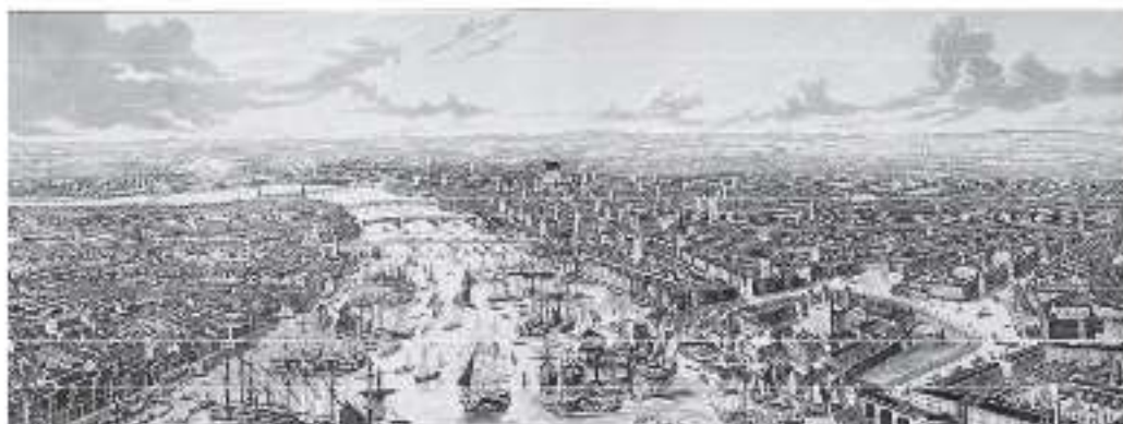
O vedere cu Londra și Tamisa

în jurul lumii, ajuns acum președinte al Societății Regale, cel mai de seamă for științific din Marea Britanie. Humboldt admira ispititoare tablouri și schițe cu care William Hodges venise din cea de-a doua călătorie alături de Cook. Oriîncotro se întorcea, i se dezvăluiau noi lumi. Chiar și dimineața, primele care-i săreau în ochi când se trezea erau gravurile cu navele Companiei Britanice a Indiilor de Est, care împodobeau pereții dormitorului unde locuia. Lui Humboldt adesea îi dădeau lacrimile când vedea aceste imagini tulburătoare, care-i aminteau de visurile sale neîmplinite. 38 Avea să scrie că „este în mine un imbold de neoprit care adesea mă face să simt că mi-am pierdut mințile” 39 .