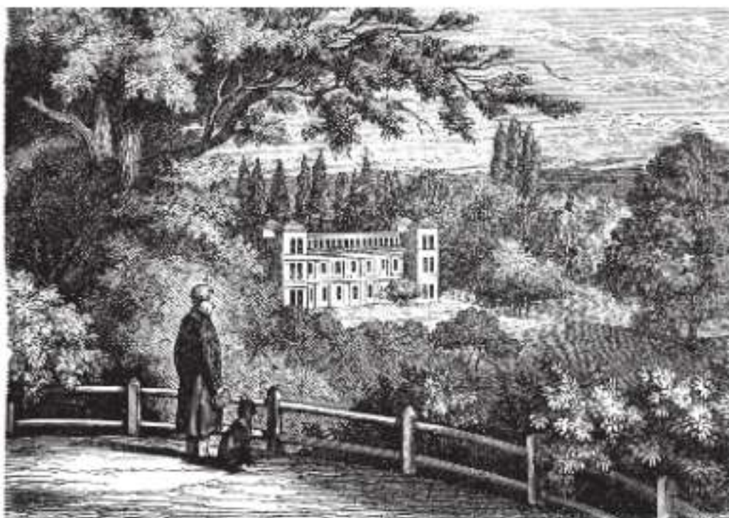
Castelul Tegel și zona din jur

Lui Alexander îi venea deosebit de greu, pentru că îi erau predate aceleași lecții ca fratelui său mai mare, în ciuda faptului că el era cu doi ani mai mic. Drept rezultat, se socotea mai puțin înzestrat decât fratele său. Pe când Wilhelm excela la latină și la greacă, Alexander se simțea incompetent și încet. Mai apoi avea să-i mărturisească unui prieten că trebuia să se străduiască