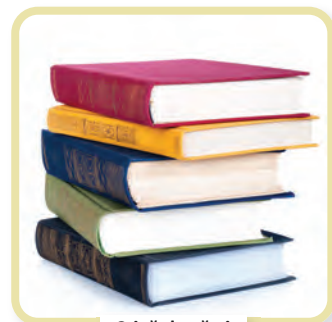
Stivă de cărți

Dificultatea cercetărilor asupra substratului limbii române provine din faptul că lipsesc informațiile privitoare la idiomurile care se vorbeau pe teritoriul cucerit de romani. Este posibil ca unitatea politică realizată de regii daci (de la Burebista la Decebal), din cauza pericolului roman, să fi determinat și o unitate lingvistică a triburilor atrase sub un steag comun.