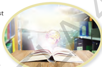
Educația în ziua de azi

(Petru Butuc, Despre noțiunile științifice de limbă literară și română literară )