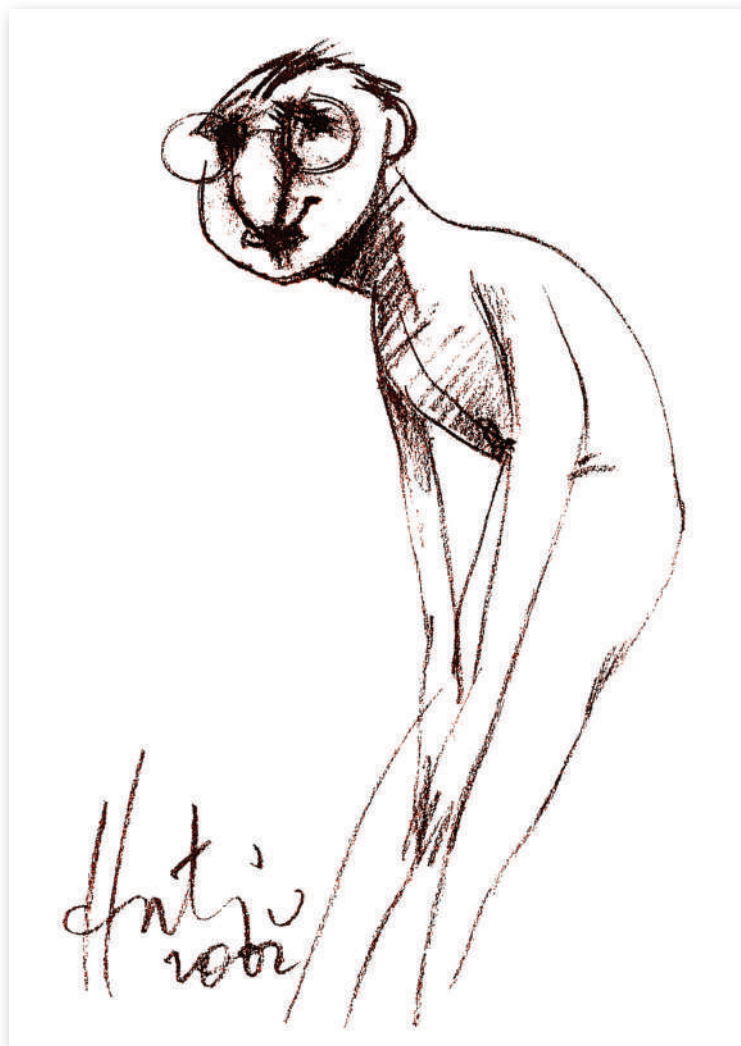
Timiditate , 2002 Cărbune pe hârtie, 21 x 30 Colecția Adi Garfunkel