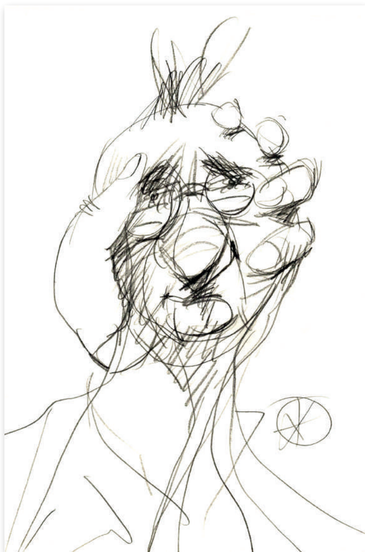
Schiță pentru un eventual autoportret , 2014 Creion pe hârtie, 21 x 30 Colecție privată