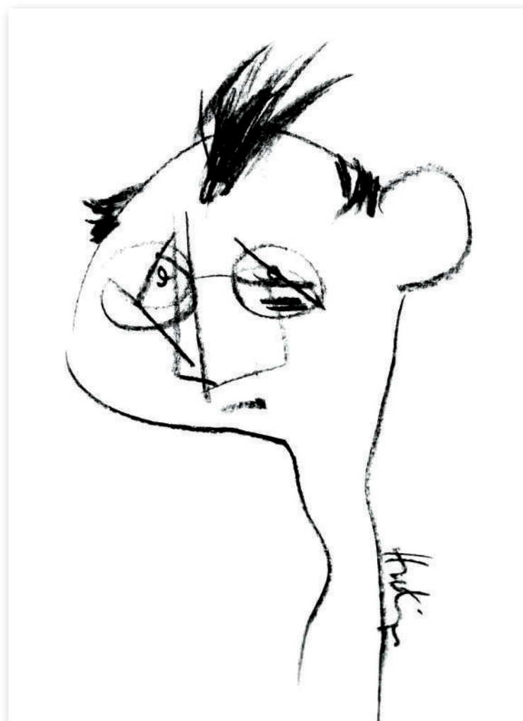
Autoportret II , 2005 Cărbune pe hârtie, 21 x 30 Colecție privată