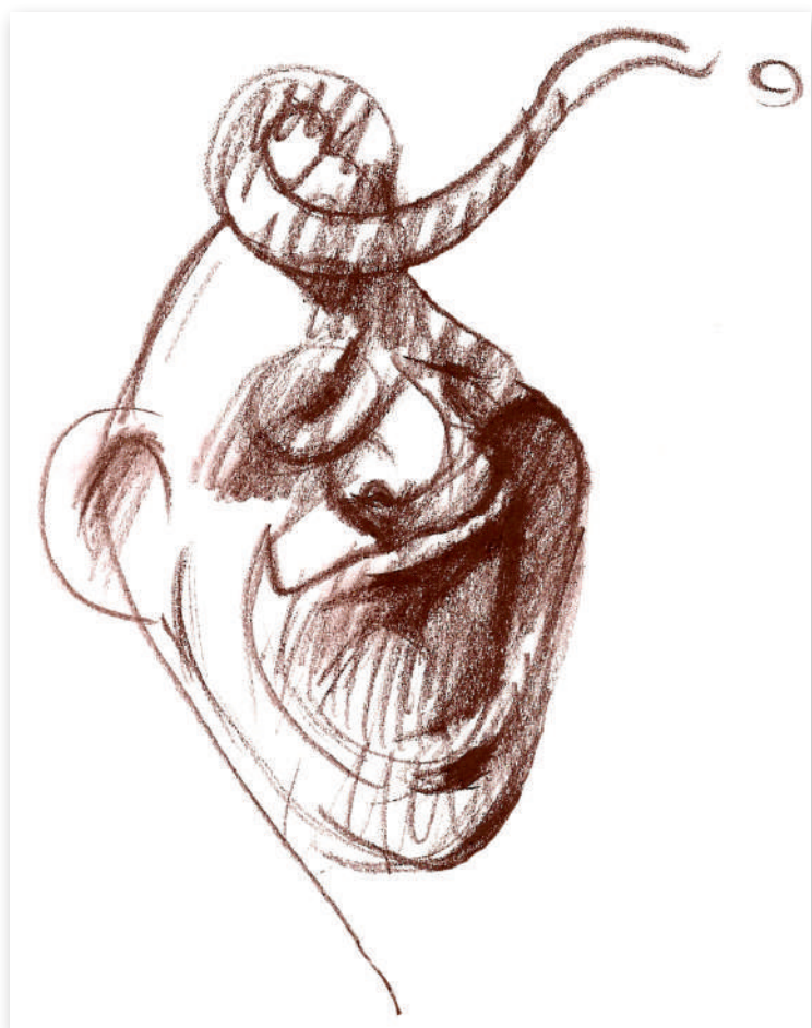
Autoportret I , 2005 Cărbune pe hârtie, 21 x 30 Colecție privată