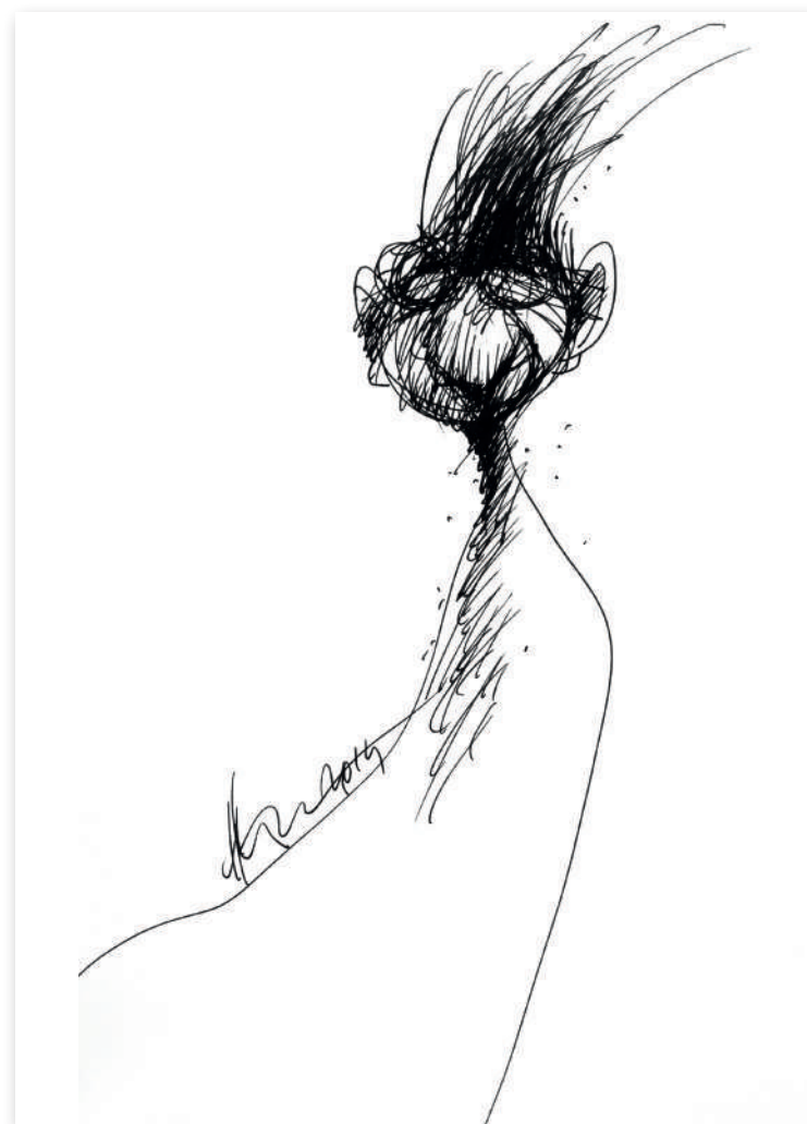
Ego , 2006 Tuș pe hârtie, 21 x 30 Colecție privată