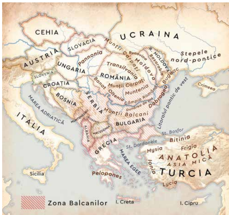
EUROPA DE SUD-EST cu granițele actuale și diversele denumiri geografice, noi sau antice, folosite în text.

Istoricii fac mereu distincția între civilizația grecească și, apoi, cea romană din jurul Mării Mediterane, pe de o parte, și popoarele din afara acestui spațiu, așa-numiții barbari, pe de altă parte. Azi, noi numim barbar pe cineva necioplit, grosolan sau brutal. În trecut, grecii i-au numit barbari pe cei ce vorbeau limbi străine, de neînțeles pentru ei. Barbarul era străinul ne-grec. Aici intrau și fenicienii, egiptenii sau latinii din Italia. Romanii au preluat termenul, dar i-au dat un sens mai restrâns. Pentru romani barbarii nu mai erau cei de altă limbă (și în niciun caz popoare precum egiptenii sau grecii), ci popoarele din afara lumii elenistice și romane – în special neamurile de dincolo de hotarele imperiului. Această lume, indiferent de neam, a primit și un nume: Barbaricum , „lumea barbară“.