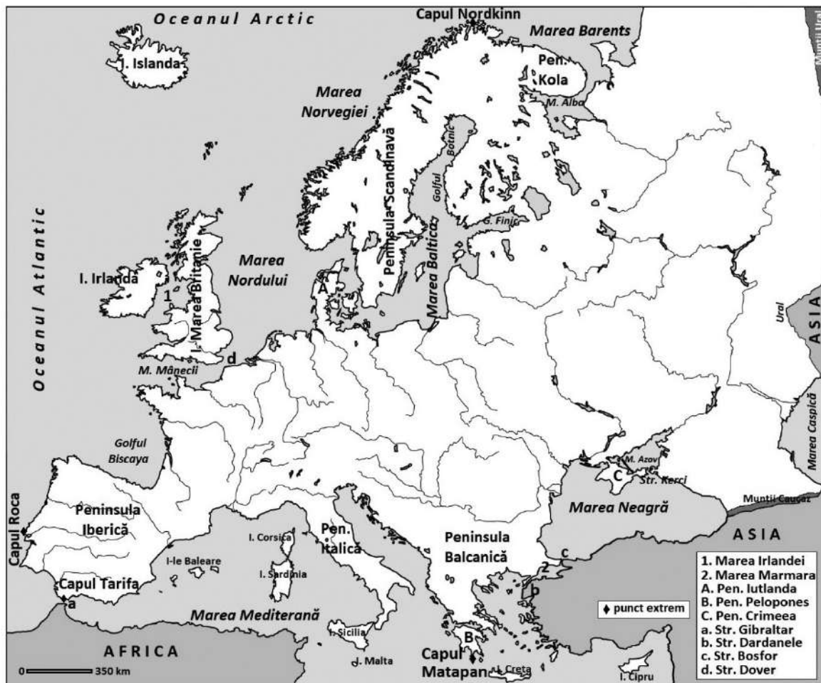
Fig. 1. Spațiul european

d. strâmători: Kerçi (leagă mările Azov și Neagră), Bosfor (între Europa și Asia, leagă mările Neagră și Marea Marmara), Dardanele (între Europa și Asia, leagă mările Marmara și Egee), Messina (între Peninsula Calabria și Insula Sicilia, leagă mările Ionică și Tireniană), Gibraltar (între Europa și Africa, leagă Marea Mediterană de Oceanul Atlantic), Pas de Calais/Dover (leagă mările Mânecii și Nordului) etc.