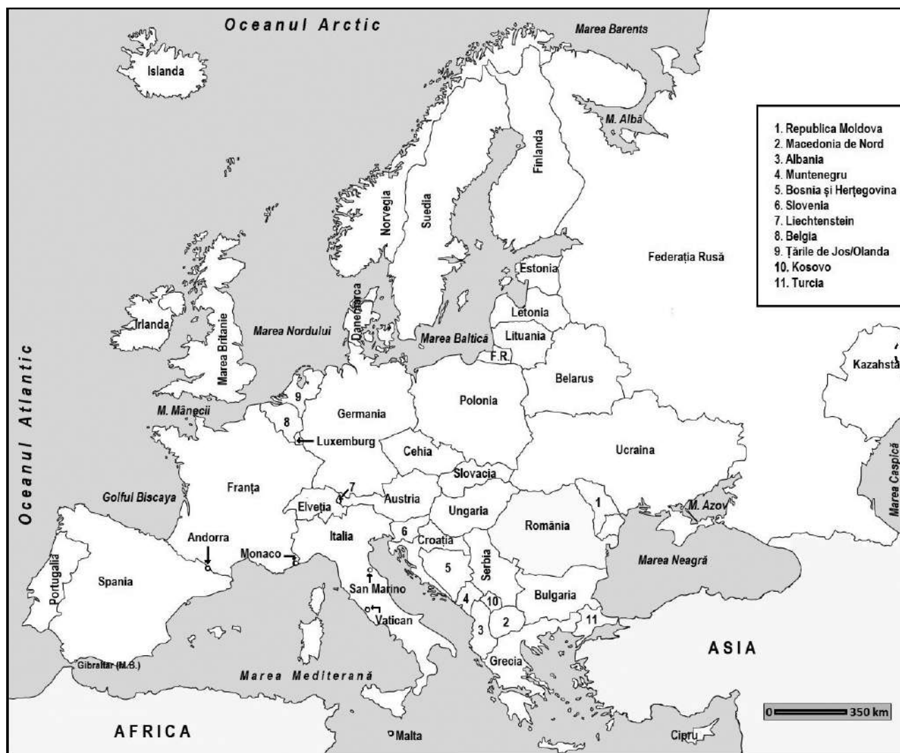
Fig. 2. Europa – harta politică

În prezent, spațiul european este administrat de 48 de state (fig. 2), dintre care unul cu recunoaștere parțială (Kosovo) și două care aparțin, prin poziția geografică a capitalei, Asiei (Kazahstan și Turcia).