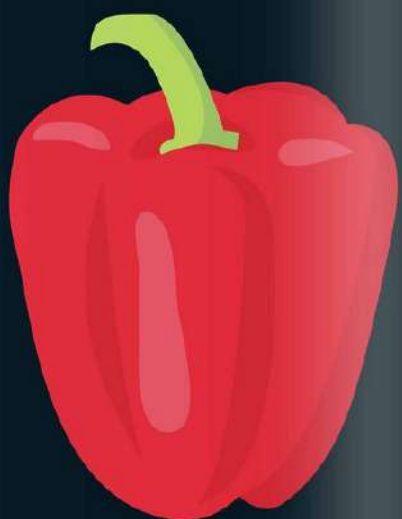
Un ARDEI gras și lucios.