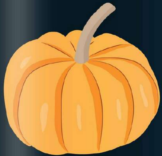
Un DOVLEAC gata de copt.