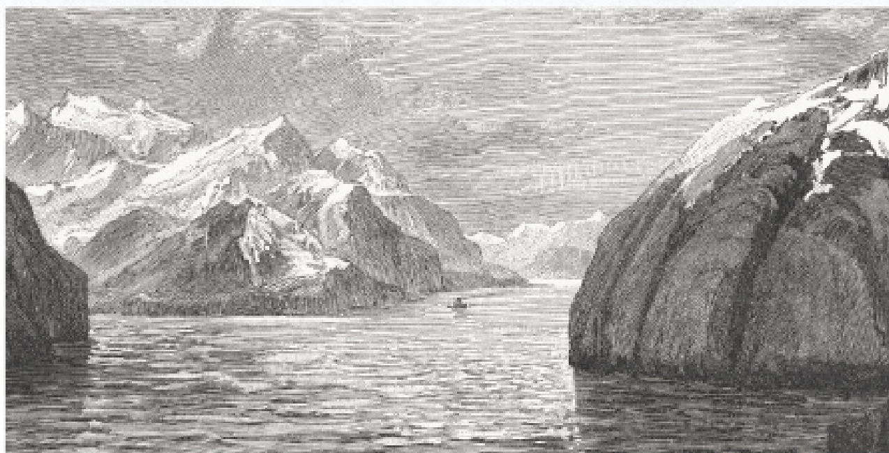
Strâmtoarea Magellan. Gravură publicată în anul 1897.