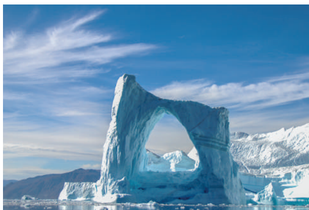
Peisaj de la Polul Nord

După două zile de navigat pe Marea Barents, am ajuns în zona arhipelagului Franz Josef, la aproximativ 1.000 de kilometri de Polul Nord. Peisajul era spectaculos. Uimitor. Au apărut banchizele. Am văzut primele balene. Cu cât înaintam, urșii polari au început să-și facă și ei apariția. Unul mai curios și, după cum arăta, cam flămând, s-a apropiat mult de nava oprită. Altul își căuta în continuare hrana, fără să pară în vreun fel interesat sau deranjat de prezența noastră. Zgomotul elicopterului speriasse o ursoaică și puii ei. Fără îndoială, a fost pentru prima dată când au auzit un asemenea sunet. [...]