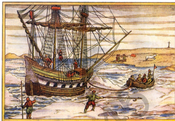
Gravură din 1598 ilustrând nava lui Willem Barents prinsă între ghețurile arctice

( La Polul Nord: experiența fără limite , text preluat de pe https://www.calatoriilasingular.ro )