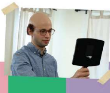
„The Try Guys cu chelie!”

Mi-era teamă că un Zach chel ar fi semănat mai degrabă cu un pul ciudat de broască țestoasă decât cu fermecătorii Dwayne Johnson, Bruce Willis sau Vin Diesel. Pot să confirm în mod cert că fizic nu am nicio legătură cu băleții în cauză, dar și că dacă voi cheli, nu va fi sfârșitul lumii. Am să mă obișnuiesc, am să mă adaptez, poate am să devin un șofer de viteză sau un super erou internațional (cu aluzie la Vin Diesel). Cine știe, poate chiar în momentul în care citești cartea asta, sunt ras în cap fiindcă mi s-a urât deja.