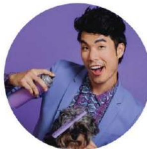
EUGENE LEE YANG: Oaia Neagră

Această filosofie m-a însoțit pe timpul facultății și când m-am alăturat colectivului BuzzFeed. Acolo am putut să-mi îmbin pasiunea pentru creație cu sfatul de a trăi cu adevărat fiecare clipă. O, și încă ceva: în perioada când am lucrat la BuzzFeed i-am cunoscut și pe ameziții ăștia trei cu care scriu acum această carte.