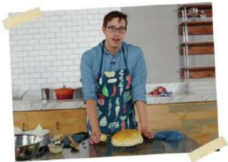
* „The Try Guys fac pâine fără rețetă” (NYL)

Dar eu nu m-am putut resemna toată ziua. Acum, când îmi aduc aminte, sunt mai stânjenit de comportamentul meu decât de pâinea complet nereușită. Și așa, tot am învățat ceva din filmarea asta. Eram prea furios ca să mă fac înțele atunci, dar chiar dacă a fost cel mai semnificativ eșec al meu, tot am învățat cum să nu bat ouăle.