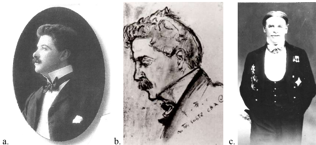
Fig. 1.1. În trei epoci: a. înainte, b. în timpul și c. după primul război mondial

Charles-Adolphe Cantacuzène scriind despre el însuși, s-a definit astfel: „Un copil al unei țări frumoase, nobile, grave și vechi, cu inflexiuni și grații latine”.