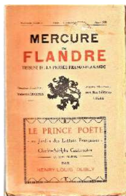
"Le Prince Poet" (H.-L. Dubly 1929), unul din volumele de critică literară dedicate lui S.A. Cantacuzino

- Poet, eseist și critic literar în limba franceză – 46 volume