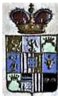
Ex-librisul pecete de pe cărțile poetului