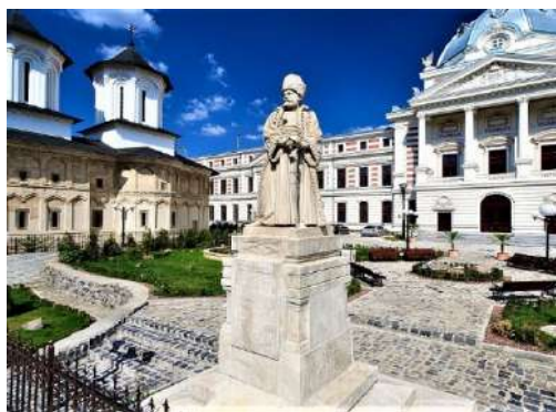
Statuia spătarului Mihai Cantacuzino (1640 – 1716), lângă Biserica și Spitalul Colțea construite de el în centrul Bucureștiului. Mihai Cantacuzino, ascendent a lui S.A. Cantacuzino, este ctitorul Mănăstirii Sinaia

- Poet, eseist și critic literar în limba franceză – 46 volume