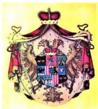
Emblema familiei Cantacuzino "Quo nocent docent" (Iorga 1902a), cu vulturul bicefal de la împărații bizantini

- A contribuit la continuarea tradițiilor istorice și culturale ale familiei Cantacuzino , descendent din împărați bizantini, domnitori în Țările Române și personalități în diferite părți ale Europei.