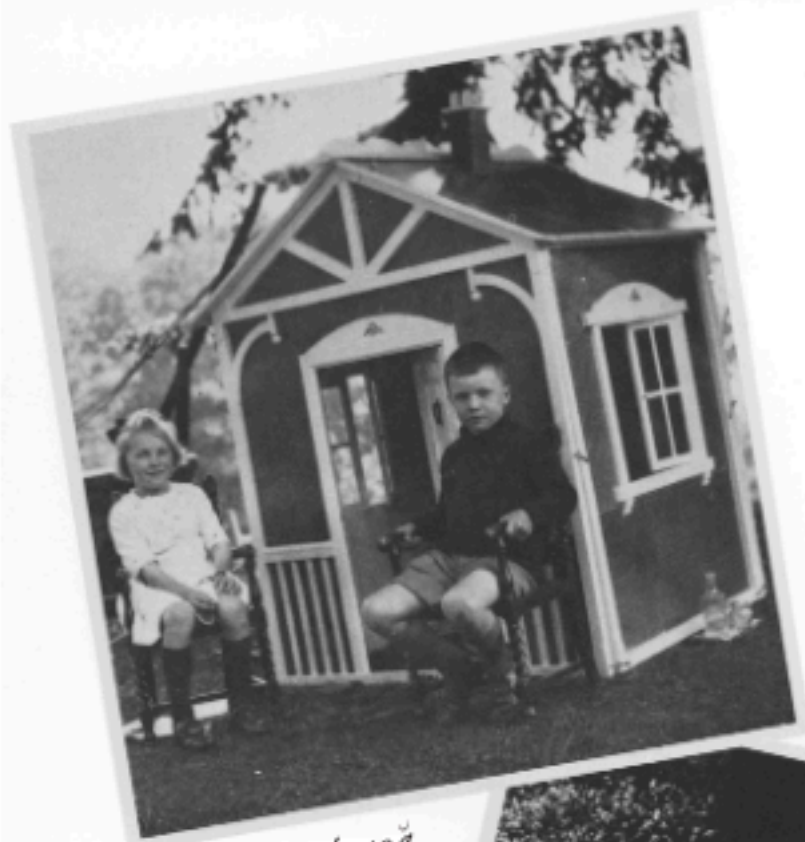
Căsuță de joacă