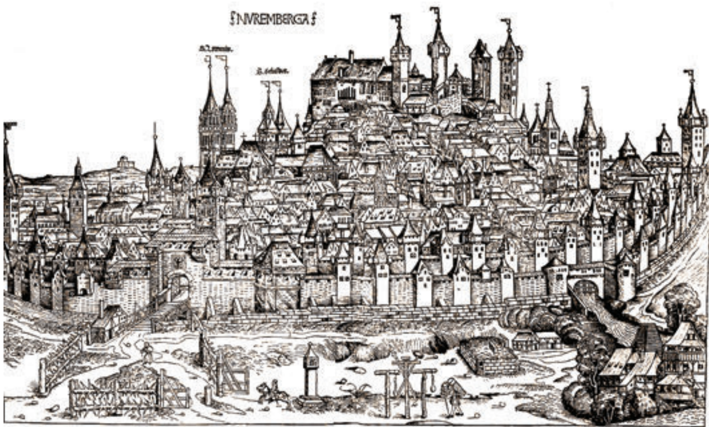
Orașul Nürnberg – gravură de epocă (sec. al XV-lea). În ziua de 8 februarie 1431, în catedrala orașului s-a desfășurat ceremonia de primire în rândul Cavalerilor Ordinului Dragonului a prințului valah Vlad.

cea ce în slavonă înseamnă „cel fără cap, fără minte“, cu alte cuvinte „Radu cel Prost“!