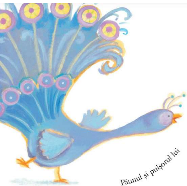
Păunul și puișorul lui

cozile și-ar înfoia și-ar dansa, și țopăind cam tra-la-la pupici de noapte bună și-ar tot da.