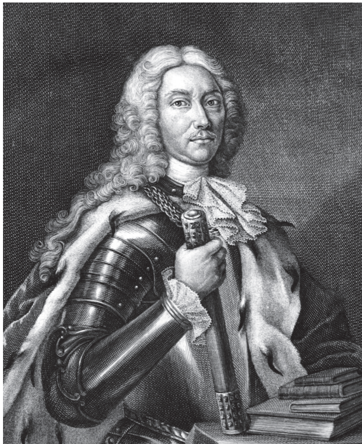
Dimitrie Cantemir (1673/1674-1723)