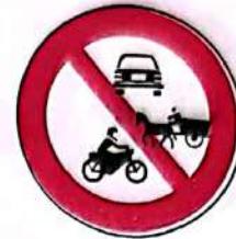
Accesul interzis autovehiculelor și vehiculelor cu tracțiune animală