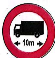
Accesul interzis autovehiculelor sau ansamblurilor de vehicule, cu lungimea mai mare de ...m