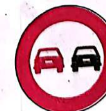
Depășirea autovehiculelor, cu excepția motocicletelor fără ataș, interzisă