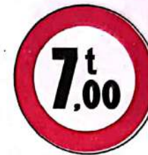
Accesul interzis vehiculelor cu masa mai mare de ...t