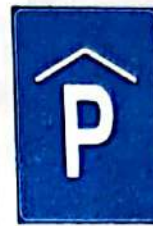
Parcare subterană sau în clădire