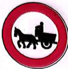
Accesul interzis vehiculelor cu tracțiune animală