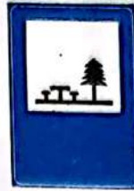
Loc pentru popas