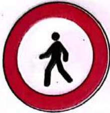
Accesul interzis pietonilor