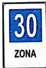
Zonă cu viteză recomandată 30km/h