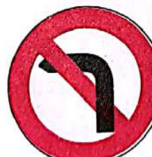
Interzis a vira la stânga