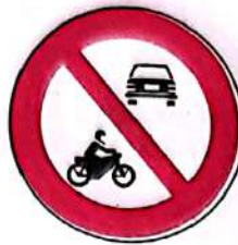
Accesul interzis autovehiculelor