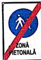
Sfârșitul zonei pietonale