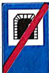
Sfârșit de tunel