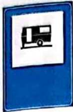
Teren pentru caravane (tabără turistică)