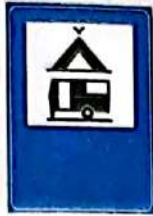
Teren pentru camping și caravane