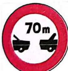
Interzis autovehiculelor de a circula fără a menține între ele un interval de cel puțin ...m