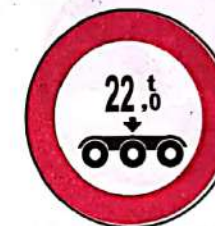
Accesul interzis vehiculelor cu masa pe osia triplă mai mare de ...t