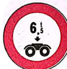
Accesul interzis vehiculelor cu masa pe osia dublă mai mare de ...t