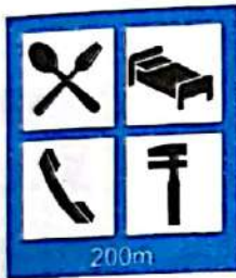
Complex de servicii