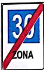
Sfârșitul zonei cu viteză recomandată 30km/h