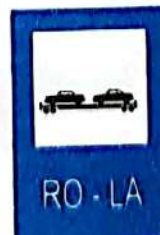
Îmbarcare pe vagoane platformă de cale ferată