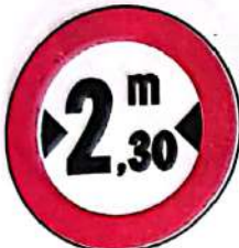
Accesul interzis vehiculelor cu lățimea mai mare de ...m