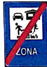
Sfârșitul zonei rezidențiale