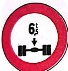
Accesul interzis vehiculelor cu masa mai mare de ...t pe osia simplă