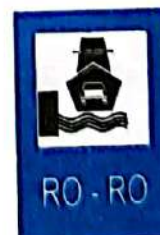
Îmbarcare pe ferry-boat