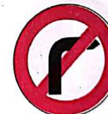
Interzis a vira la dreapta