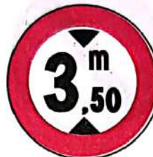
Accesul interzis vehiculelor cu înălțimea mai mare de ...m