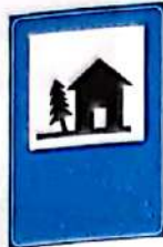
Cabană pentru turiști