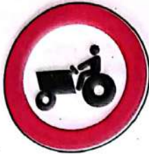
Accesul interzis tractoarelor și mașinilor autopropulsate pentru lucrări