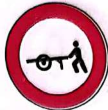
Accesul interzis vehiculelor împinse sau trase cu mână