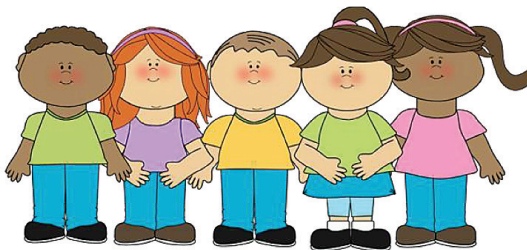
Paul Anne Andrew Maria Lora

Cerință 2: Răspunde la următoarele întrebări și completează spațiile libere, ținând cont de indicații și imagini: