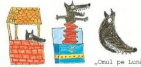
„Motanul din fântână” „Jack din cutie” „Omul pe Lună” Lupii ajung peste tot!

Câteva sfaturi bune pentru băieți și fete - bunici - vânători - porcușori - băieți din turtă dulce - sendvișuri cu curcan și iaurturi cu ananas - (lupii mănâncă orice!)