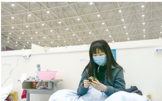
O pacientă se joacă în patul ei cu un cub Rubik.