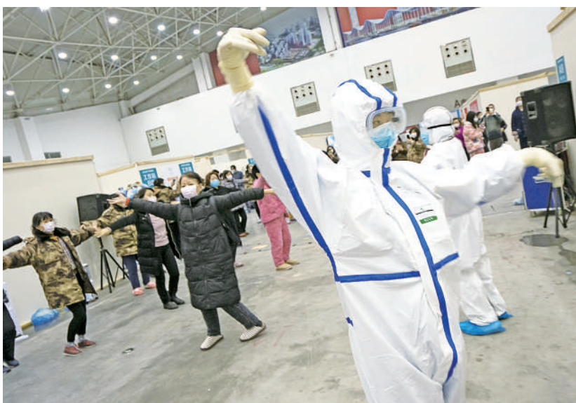
Asistentele le arată pacienților mișcări de dans și exerciții fizice ușoare, pentru a-i ajuta să se destindă.

După declanșarea epidemiei, tehnologia modernă de comunicare le-a permis oamenilor să obțină informații la zi despre situație, însă unora dintre ei le-a și provocat anxietate și panică. Ca urmare, în spitalele temporare au fost introduse și măsuri de psihoterapie. De exemplu, s-a inițiat un mecanism de consiliere psihologică prin participarea unor profesioniști, pacienții au fost încurajați să se ajute unii pe alții, să citească cărți și să își caute pacea interioară și li s-au distribuit materiale cu informații medicale elementare.