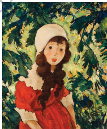
Nicolae Tonitza, Fata pădurarului

Într-o zi, pe când vara se instalase confortabil, Ana, fetița cochetă cu păr bălai, nas cârn și o aluniță pe obrazul stâng, s-a gândit să-i facă o surpriză prietenei sale, Artemis. S-a dus hotărâtă să culeagă flori suave precum chipul luminat și angelic al lui Artemis, de prin poienițele dumbrăvii de la marginea satului. Îmbrăcată în rochie nouă de culoarea fulgilor imaculați de nea, aceasta a țopăit din loc în loc adunând mănunchiuri de flori azurii de culoarea ochilor prietenei sale.