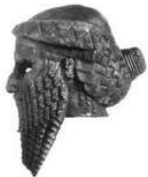
Akkad 2334-2154 î.Hr.

..... catastrofică a 100 î.Hr., care a Creta.