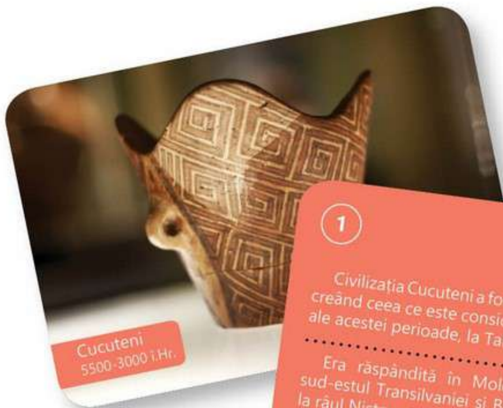
Cucuteni 5500-3000 î.Hr.