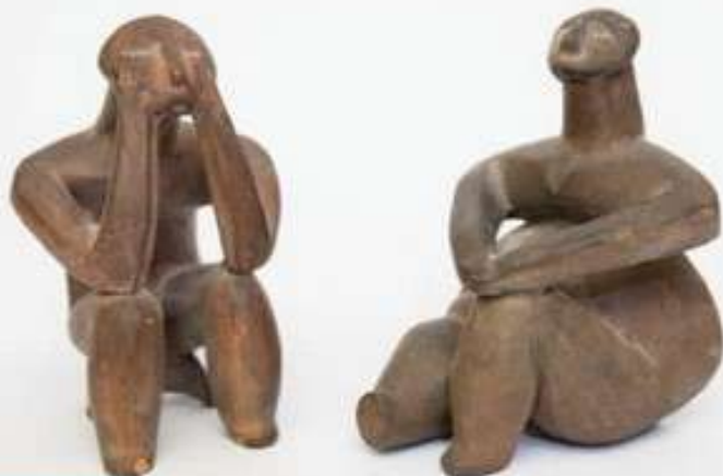
Hamangia 5200-4500 î.Hr.