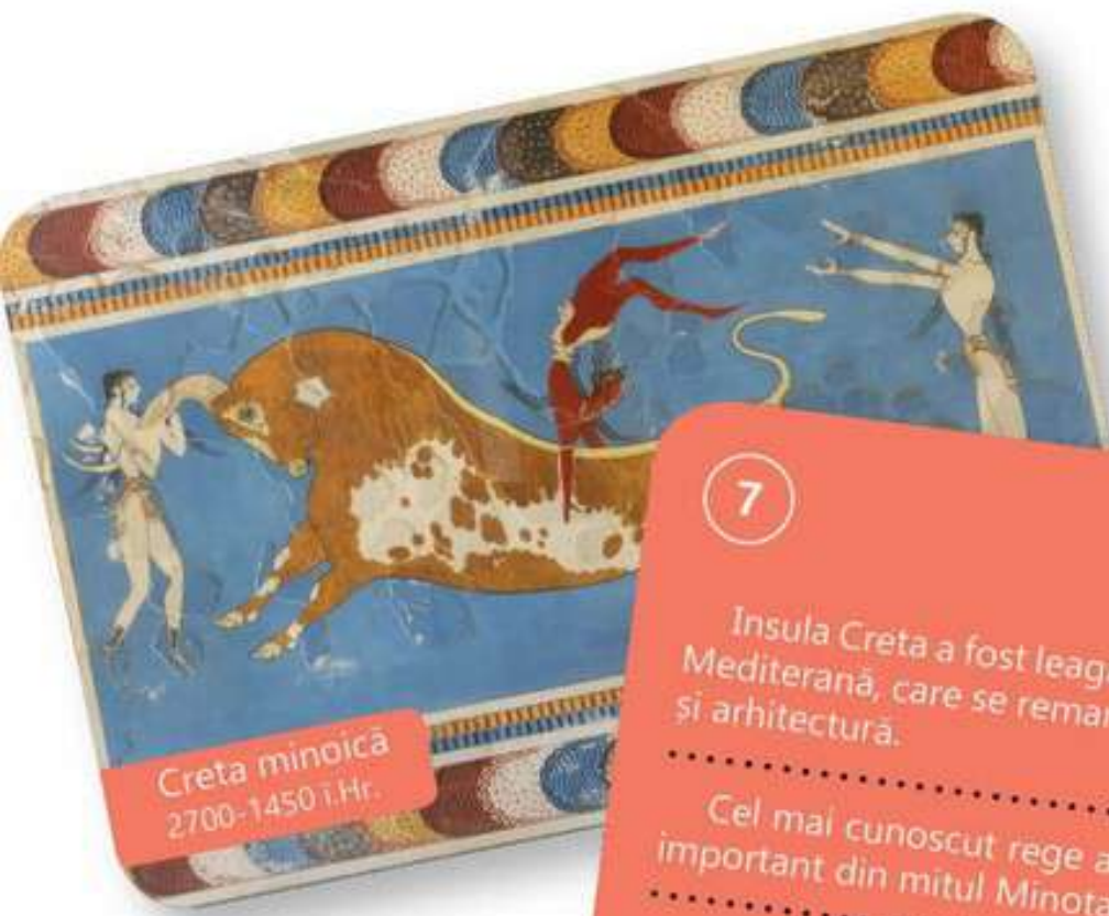
Creta minoică 2700-1450 î.Hr.