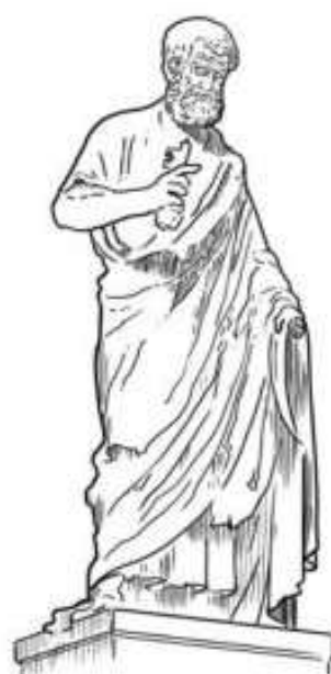
STATUIE A SFÂNTULUI PETRU

Papa este conducătorul Bisericii Catolice. Primul papă a fost Petru, unul dintre cei doisprezece discipoli ai lui Isus. Petru a fost ucis din cauza credinței sale, la ordinul împăratului roman Nero, în anul 67. Mulți alți papi au fost uciși în timpul Imperiului Roman. Dar în anul