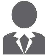
Complexitate mare ∞

Gândește-te la locul tău de muncă. Pare mai degrabă complex? Există zone în care deciziile corecte ar face o diferență majoră în ceea ce privește rezultatele tale? Ești dispus să aloți timp și energie pentru a lua decizii valoroase?