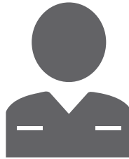
Complexitate medie x12