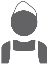
Complexitate redușă x3

cu cele mai slabe performanțe. În joburile de complexitate medie (de exemplu, un lucrător într-o fabrică high-tech), angajații de top s-au dovedit a fi de douăsprezece ori mai productivi. Însă în joburile de complexitate mare, unde deciziile corecte fac diferența (precum un inginer software sau un expert într-o firmă de investiții bancare), diferențele dintre cei cu performanțe de top și cei mai slabi erau atât de mari, încât nu au putut fi măsurate. 1