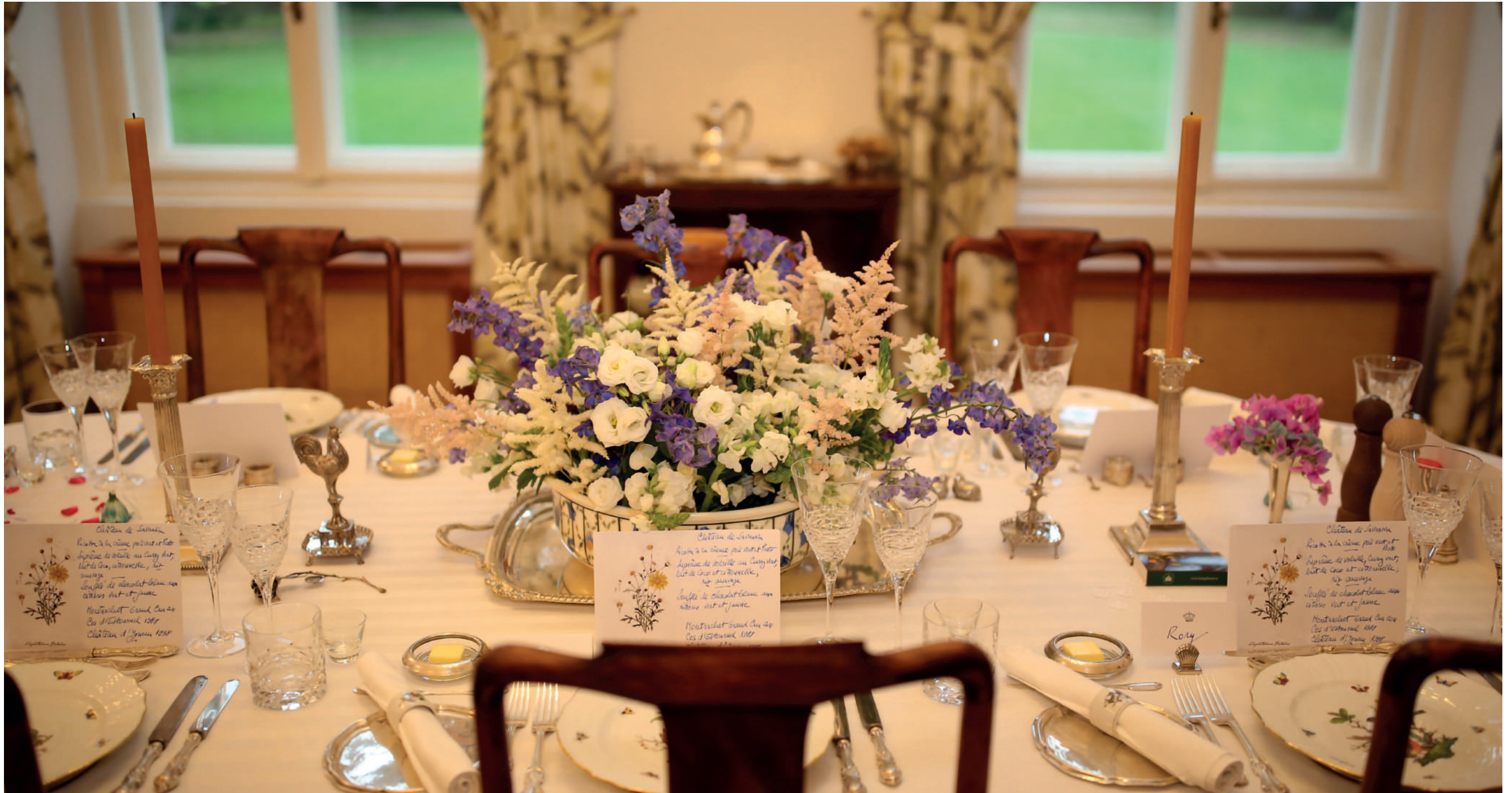
Sufrageria Mică, Castelul Săvârșin