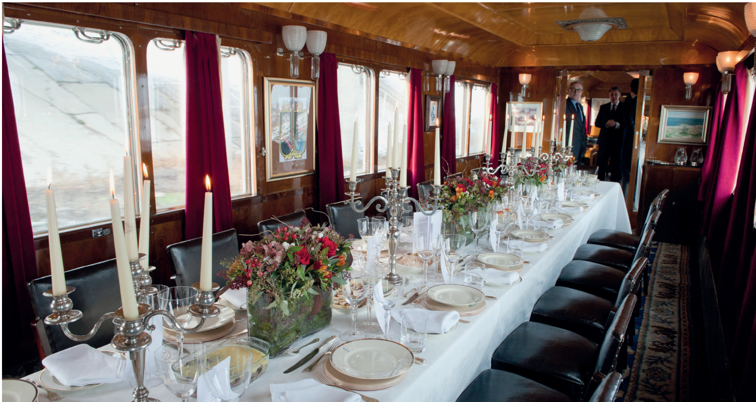
Sufrageria, Trenul Regal