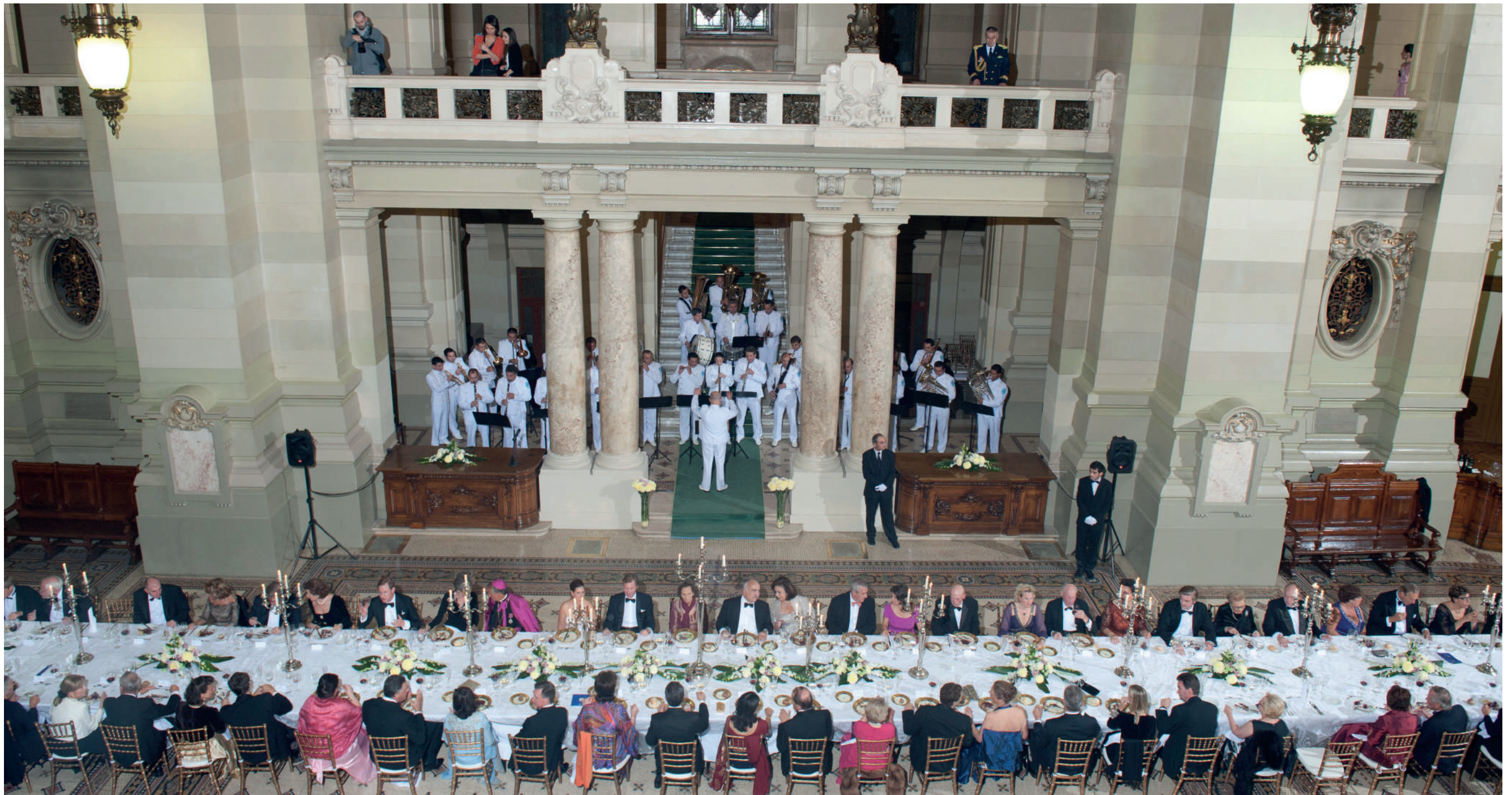
Palatul C.E.C. (Casa de Economii și Consumații)

M J V S D | L M M J V S D | L M M J V S D | L M M J V S D | L M M J V 1 2 3 4 5 | 6 7 8 9 10 11 12 | 13 14 15 16 17 18 19 | 20 21 22 23 24 25 26 | 27 28 29 30 31