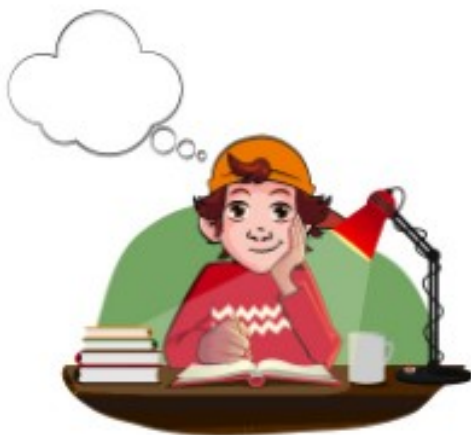
Caiet de vacanță – clasa a III-a