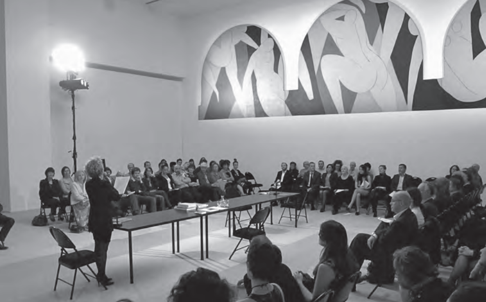
Brâncuși împotriva Statelor Unite. Sala Matisse a Muzeului de Artă Modernă din Paris, 2013.