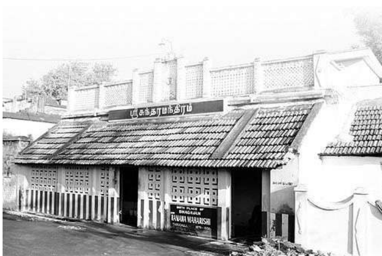
Casa natală din Tiruchuli