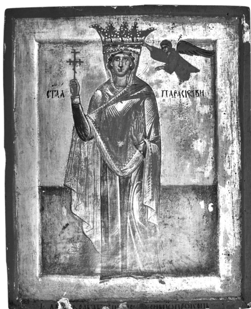
Icoana Sfintei Cuvioase Parascheva, sec. XVII, Muzeul Mănăstirii Bistrița, județul Neamț