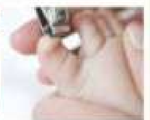
Unghiile Unghiile bebelușului tău se schimbă în jur de o dată pe săptămână. Dacă unghiile bebelușului tău sunt prea lungi, medicul tău va recomanda să le tăie.