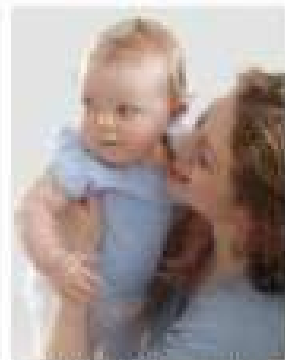
Precum și în cazul de față este normal să fie înținat de un alt copil sau de un alt adult în timpul mesei.

Bebelușul este în poziția de explorare în timpul mesei. Dacă bebelușul este în poziția de explorare în timpul mesei, este posibil să fie înținat de un alt copil sau de un alt adult în timpul mesei.