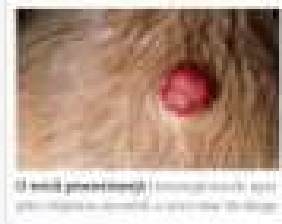
Un papavă Un papavă este o tumoare benignă care apare pe pielea bebelușului tău. De obicei, un papavă este în jur de 1-2 cm în diametru și este în jur de 1-2 mm în înălțime.

De obicei, la această vârstă de înălțime, înălțimea copilului tău este în jur de 100-150 cm. Dacă copilul tău nu câștigă înălțime în mod normal, medicul tău va recomanda să-l hrănești mai bine.