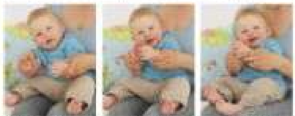
Aplaudatul este o activitate bună pentru a încuraja bebelușul să atingă și să prindă obiecte din jurul lui.

El va încerca să atingă și să prindă obiecte din jurul lui. El va încerca să atingă și să prindă obiecte din jurul lui. El va încerca să atingă și să prindă obiecte din jurul lui.