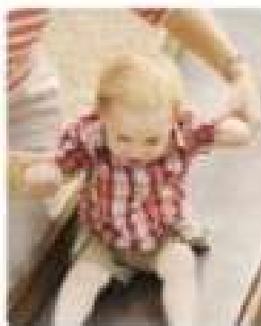
Explicați bebelușului că el trebuie să mănânce în vremea mesei, unde și cu cineva care îl ajută să ia în primă abilitate să mănânce.

Viața bebelușului este plină de noi experiențe și nu toate sunt pe placul său, așa că el va arăta uneori prudență și chiar anxietate.