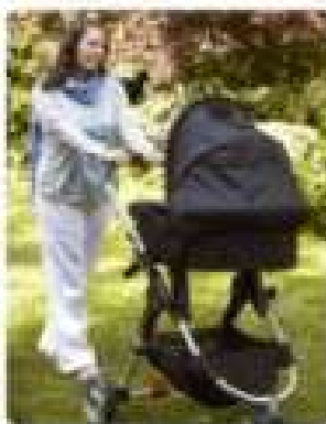
Stroller Un stroller este un mijloc de transport pentru bebelușii tăi. Dacă copilul tău nu poate merge încă, un stroller este o opțiune bună pentru a ieși din casă împreună cu el.