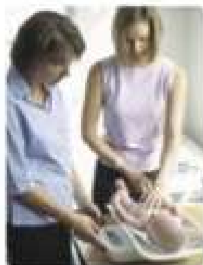
Medicinușii gravizi! În fiecare săptămână, medicul tău va verifica greutatea și înălțimea bebelușului tău. Dacă medicul tău observă că bebelușul tău nu câștigă greutate în mod adecvat, medicul tău va recomanda să-l hrănești mai bine.

La această vârstă, câteva grame contasează foarte mult, mai ales atunci când îți dorești ca bebelușul să înceapă să câștige greutate în mod constant.