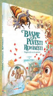
Neghinița și alte povești