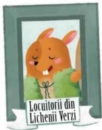
Locuitorii din Lichenii Verzi