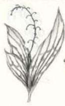
Dacă este ingerată, lăcrășimura poate provoca dureri abdominale, vomă, înetinirea ritmului cardiac și vedere încețoșată.