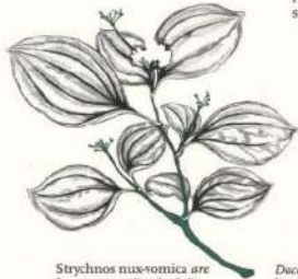
Strychnos nux-vomica are în componență stricnină, care poate provoca greață puternică, spume la gură, spasme musculare și moartea.

cea mai strictă regulă a locului: „Nu atingei, nu miroșiți!”. Macul, canabisul, ciupercile halucinogene și stricnina letală se numără printre plantele cu aspect inocent. Dat fiind pericolul acestei flore (unele plante pot ucide sau îmbolnăvi printr-o singură atingere), există plante închise în cuști, iar grădina este supravegheată 24 de ore din 24. Denwick Lane, Alnwick. Grădina este deschisă publicului din martie până în octombrie. ☎ 55.414098 ☎ 1.700515