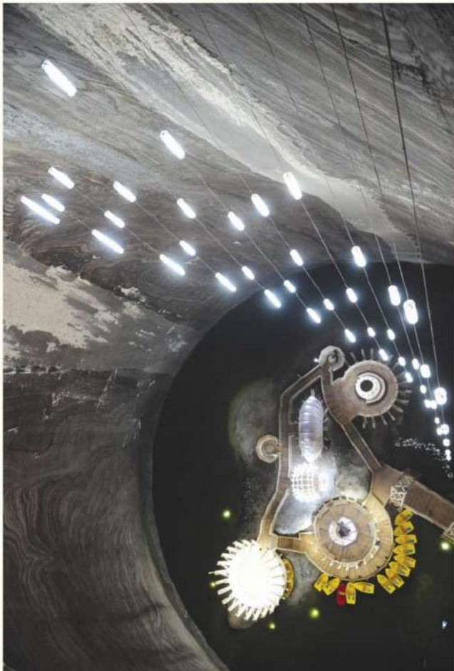
Bărci cu vâsle plutind pe lacul din interiorul sălzei Turda, România, la peste 106 m adâncime. În prezent parc subteran de amuzament, mina a produs sare din secolul al XI-lea până în anul 1930. Pagina 87.