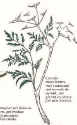
Conium maculatum, mai cunoscută sub numele de cuișoară, este planta cu care a fost ucis Socrate.