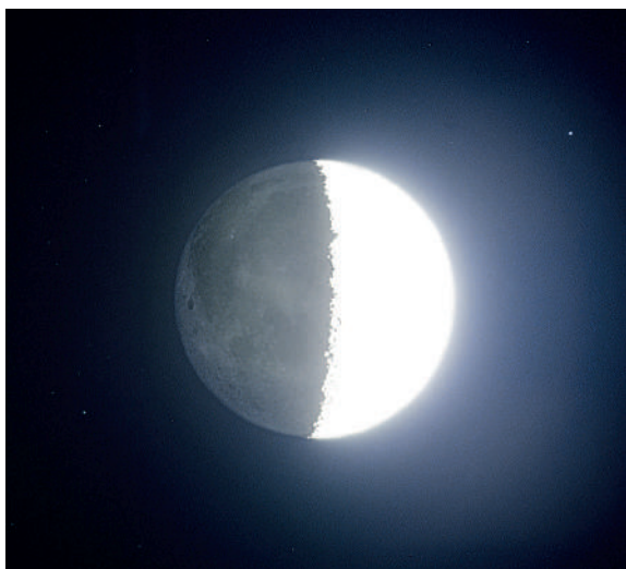
Luna în creștere, cu lumina sa „gri-cenușie”

Dacă astronomul amator are un instrument de observare gata de a fi utilizat, acesta își va pune curând întrebarea ce poate vedea pe cer cu acest aparat? Luna, cu suprafața sa denivelată este, fără îndoială, foarte frumoasă, dar mai sunt atâtea de văzut pe cerul înnelat! O trecere în revistă a celor 3000 de stele care pot fi detectate cu ochiul liber poate deveni foarte plictisitoare. Astronomul amator are tot dreptul să gândească astfel. Dar cum poate fi ajutat? Dacă dvs., cititorul nostru, vă recunoașteți în aceste rânduri, mergeți la un observator astronomic din apropiere și uitați-vă la corpurile cerești cu instrumentele accesibile publicului.