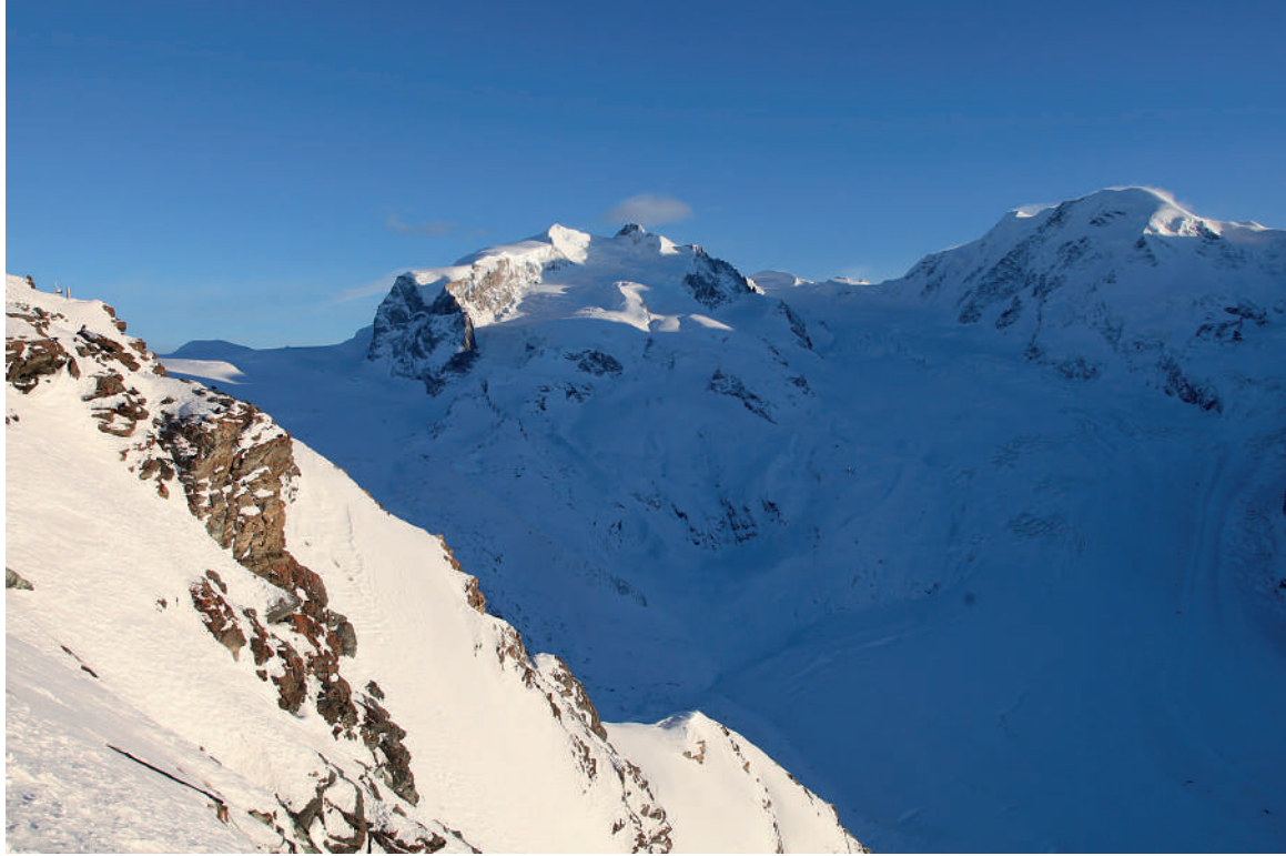
Peisaj cu zăpadă albă și albastră

pe de orizont, pare în schimb tot mai galben-portocaliu, portocaliu sau chiar roșu-portocaliu. Având în vedere că nimeni nu poate susține cu seriozitate faptul că Soarele își schimbă culoarea, trebuie că aici acționează un alt proces – poate chiar același, care este răspunzător de albastrul cerului. Pentru aceasta, să privim imaginea de la pagina 8. În partea dreaptă, Soarele este sus pe cer, iar calea parcursă de lumina sa prin atmosfera Pământului este izbitor de scurtă – doar pe ultimii aproximativ 50 de km până la sol trebuie să străbată un strat de aer de o densitate considerabilă, chiar crescătoare cu cât este mai aproape de Pământ. În partea stângă în schimb, pentru același observator Soarele este jos, la orizont. Deasupra atmosferei, lumina Soarelui este în continuare albă. În schimb observatorul de la sol vede Soarele roșiatic, chiar și cerul fiind acum scaldat în lumină roșie. Chiar și fără o analiză geometrică exactă se vede imediat că drumul