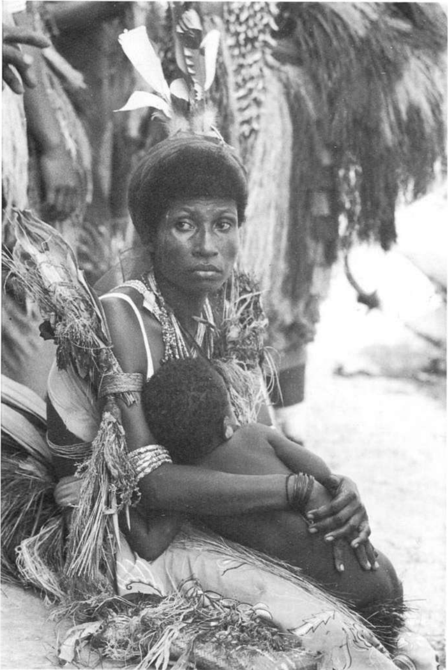
Planșa 1. Mamă și copil din ținuturile litoralului nordic al Noii Guinee (insula Siar).