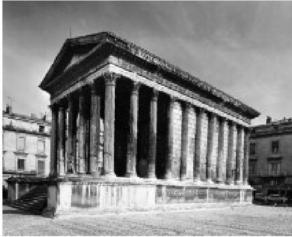
Stânga: Maison Carrée, Nîmes, cca 130 d.H.