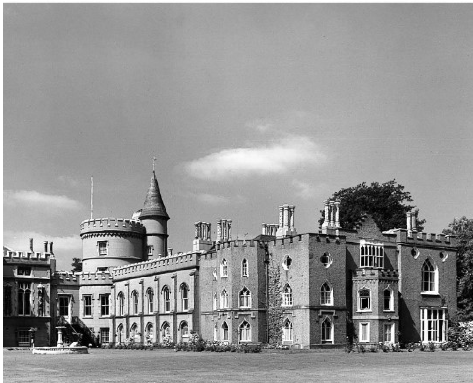
O veastă concepție privind frumusețea domestică Horace Walpole, Strawberry Hill, Twickenham, 1750–1792

(mai ales) cavaleri în armură. Walpole a decis așadar să-și construiască prima casă gotică din lume.