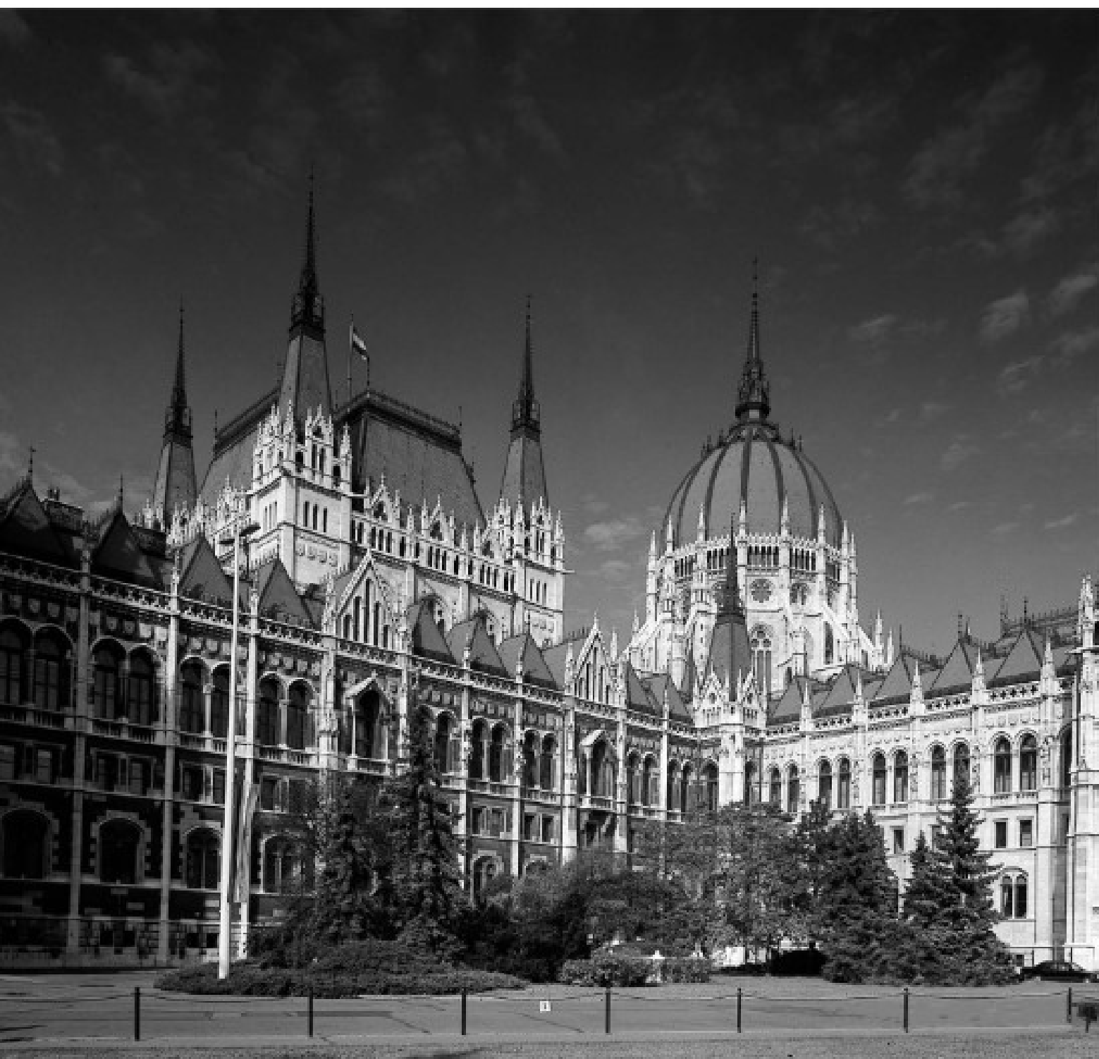
Cea mai nobilă și mai salutară arhitectură cu parietul. Imre Steindl, Clădirea Parlamentului, Budapesta, 1904