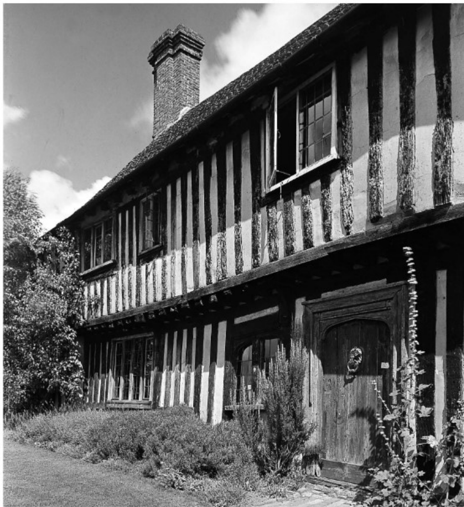
Pușini vechi au văluri, multor în gaze, cum arătau casele în alte părți ale lumii: Smallhythe Place, Tenterden, Kent, începutul secolului al XVI-lea