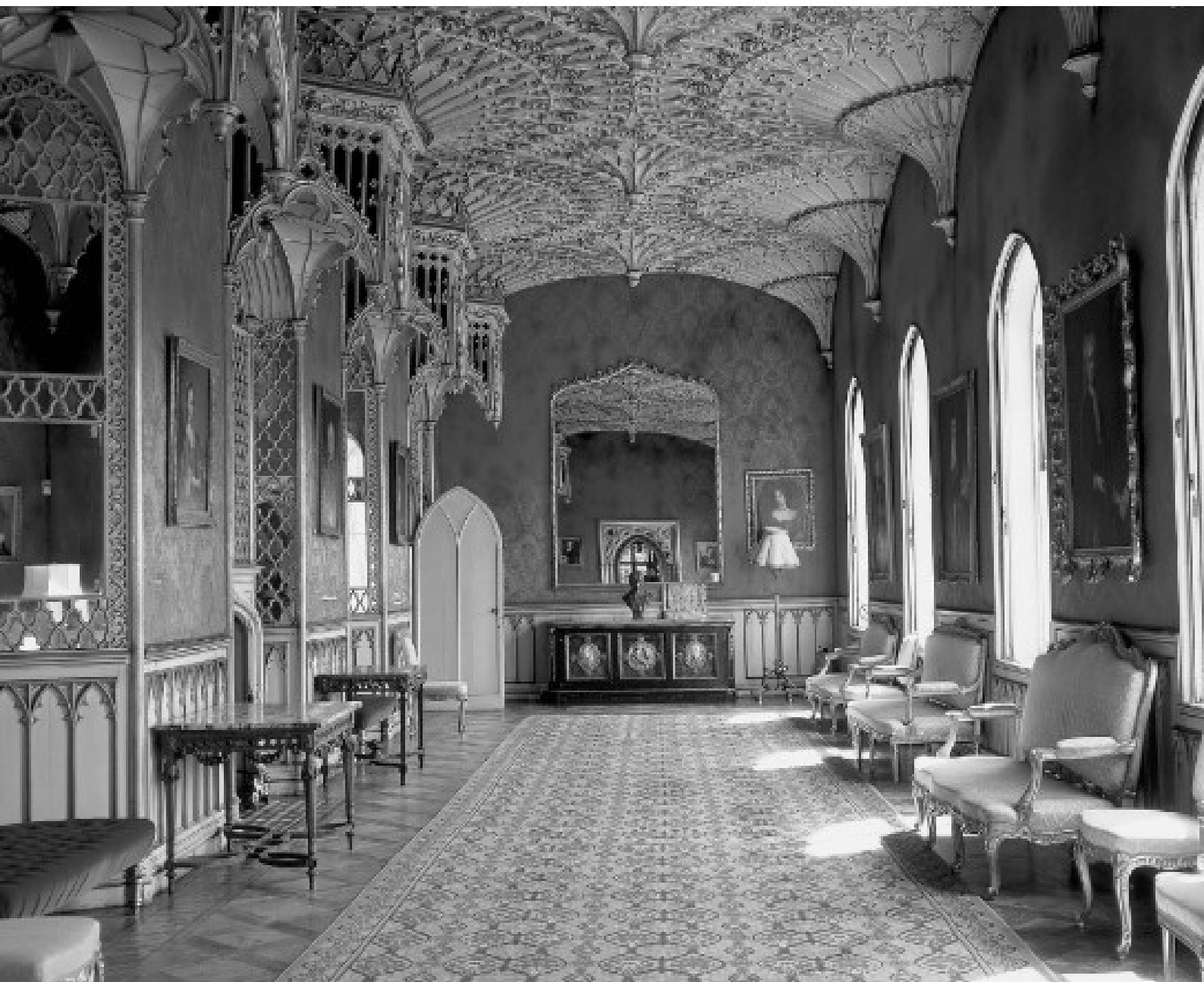
Galeria lungă, Strawberry Hill

bibliotecii sale imitau cavoul lui Aymer de Valencia din Catedrala Westminster, iar pentru tavanul sălii principale s-a inspirat din compartimentele în formă de trifoi și rozetele ce împodobesc capela abației lui Henric al VII-lea.