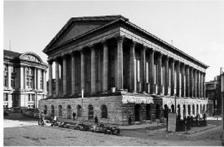
Dreapta: Joseph Hansom, Primărie, Birmingham, 1832

Hansom, instalată în mijlocul unui oraș industrial, reproduce în detaliu un edificiu roman: Maison Carrée din Nîmes ( cca 130 d.H.).