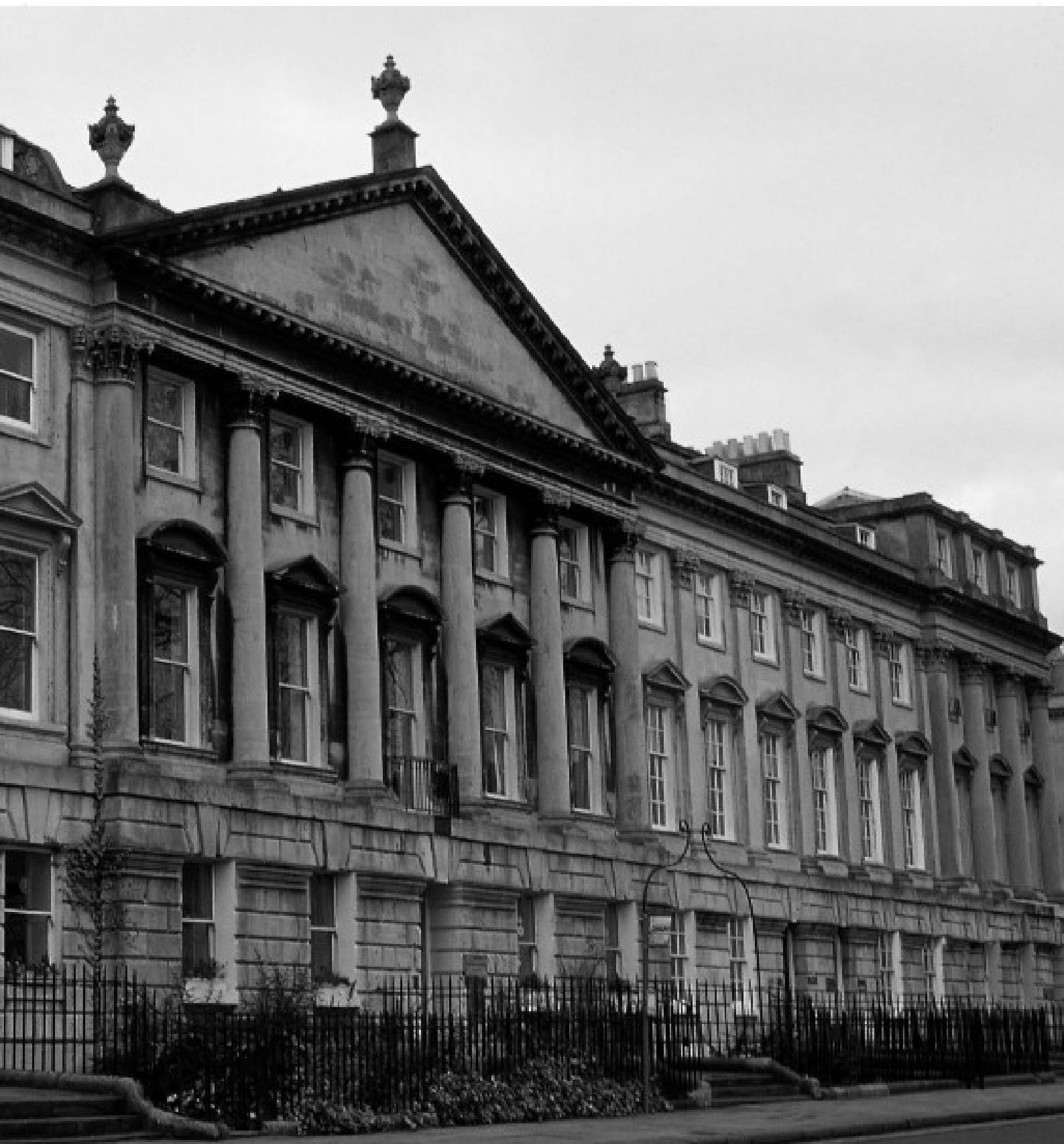
Un exemplu mare al arhitecturii neoclasiciste John Wood cel Bătrân, Queen Square – lucrarea nordică, Bath, 1736