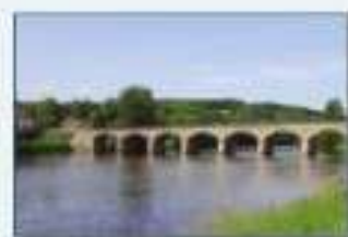
4. un pont