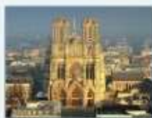
3. une cathédrale