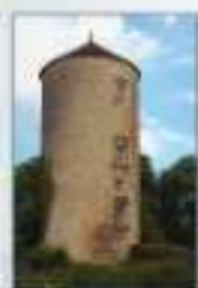
1. une tour