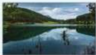
2. un lac