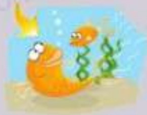
7. un poisson rouge _____

16 Regarde les dessins de l'exercice 15 et fais comme dans l'exemple.