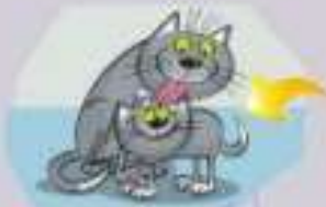
1. un chaton _____