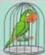
0. une perruche _____