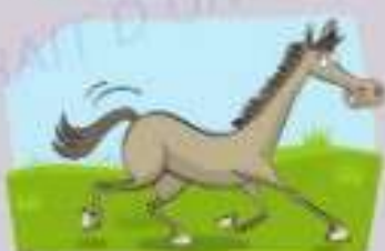
5. un cheval _____