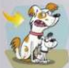
4. une chienne _____