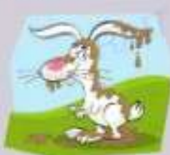
6. un lapin _____