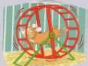
3. un hamster _____