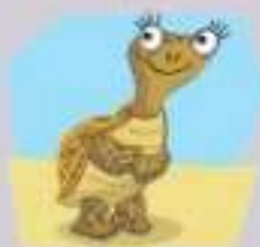
2. une tortue _____